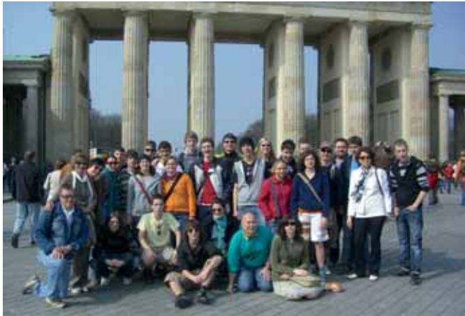
Die Delegation der Gesamtschule Niederzier/Merzenich vor dem Brandenburger Tor