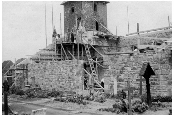
Morschenich Kirche Wiederaufbau nach dem Krieg, 1953