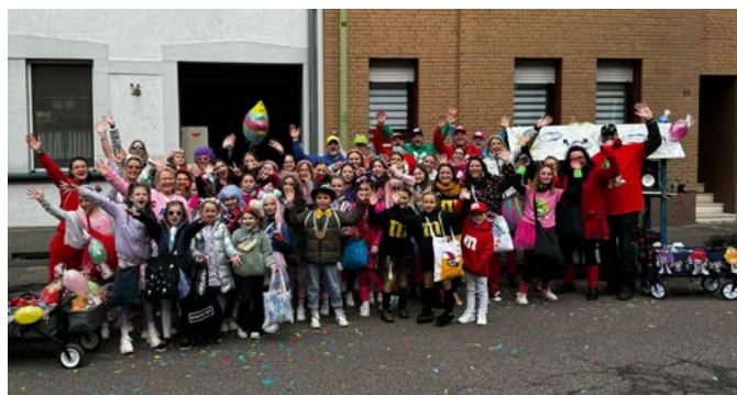
KG Jugendabteilung bei der Zugaufstellung