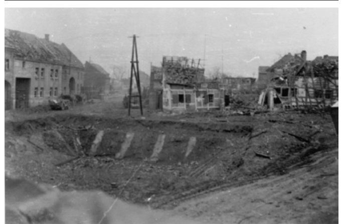
Merzenich Poolplatz, leerer Löschteich und zerstörte Häuser, 1945

Wie wurde in unseren Ortschaften dieser Herausforderungen entgegengetreten? Welche Möglichkeiten gab es, Häuser und Wohnungen zu errichten? Woher kamen das Baumaterial und