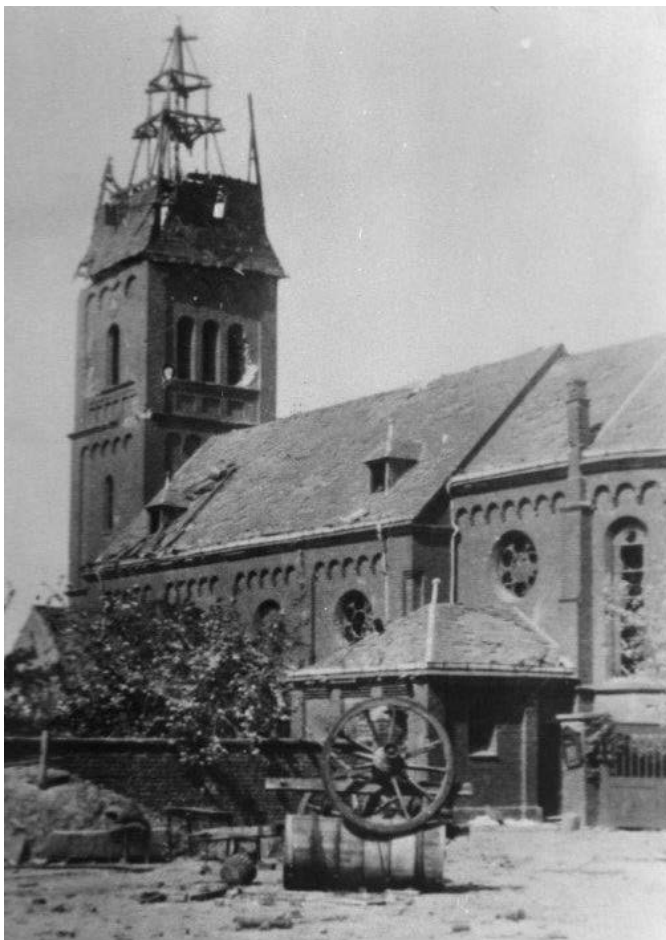
Girbelsrath Kirche mit zerstörtem Südturm, 1945

Fotografien werden selbstverständlich kopiert und an den Besitzer wieder ausgehändigt. Berichte können bei Wunsch zum Schutz der Privatsphäre anonym behandelt werden. Einsendungen und Informationen an imehlert-garms@gemeinde-merzenich.de , 02421 399 175 oder direkt bei Facebook per Messenger.