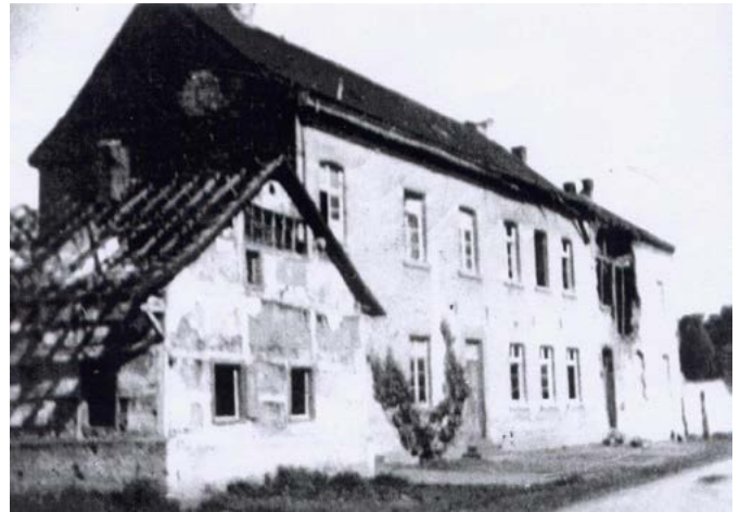
Golzheim Schule, vorne das ehemalige Küsterhaus, 1945

Ein löbliches, wenn auch ehrgeiziges Ziel. Fehlte es doch an allem – an Wohnraum, Baumaterial, Versorgungsgütern. Zugleich brauchten Kriegsheimkehrer, Evakuierte und Flüchtlinge eine Unterkunft.