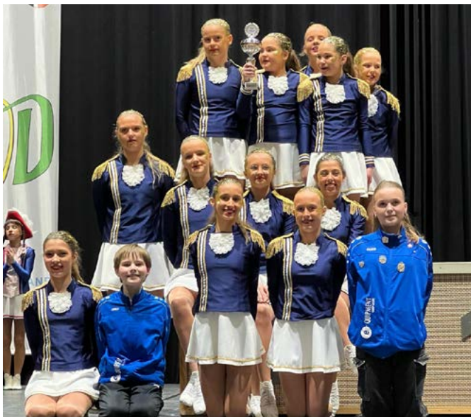
Verbandsmeister 2024 Juniorengarde