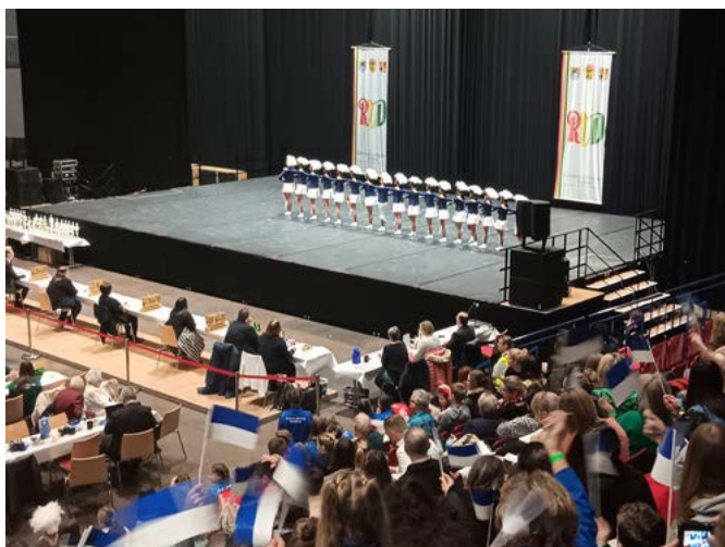
Aufmarsch Jugendgarde Arena Kreis Düren