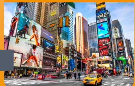
Werbetechnik: Schilder, Textildruck, Rollups uvm.