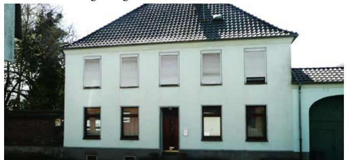
Das Pfarrhaus vor dem Abbruch im Jahr 2018.

Gemäß Vertrag mit der Gemeinde sollte das Pfarrhaus am 1. Oktober 1839 bezugsfertig sein.