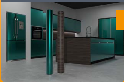
Möbelfolierung: Büros, Küchen, Schränke uvm.