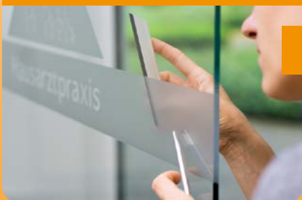
Sichtschutz: Dekor, Scheibenfolierung