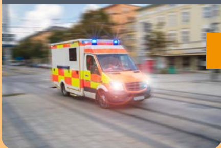
KFZ-Beschriftung: Reparaturen & Neugestaltung, Autowerbung