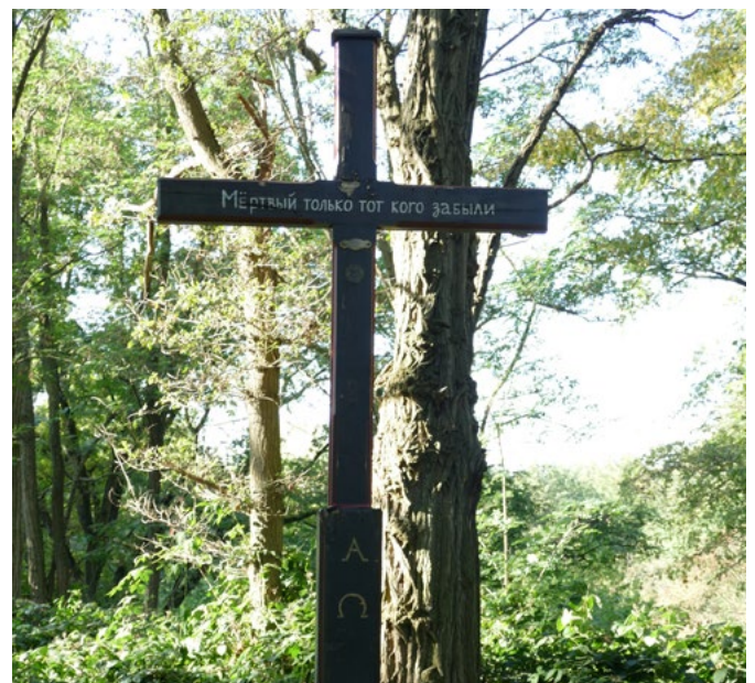
Das Holzkreuz auf dem Areal des aufgelassenen Friedhofs erinnert noch heute an die hunderten Kriegsgefangenen, die an der „Rather Hecke“ von 1940-1945 beerdigt und verscharrt wurden.