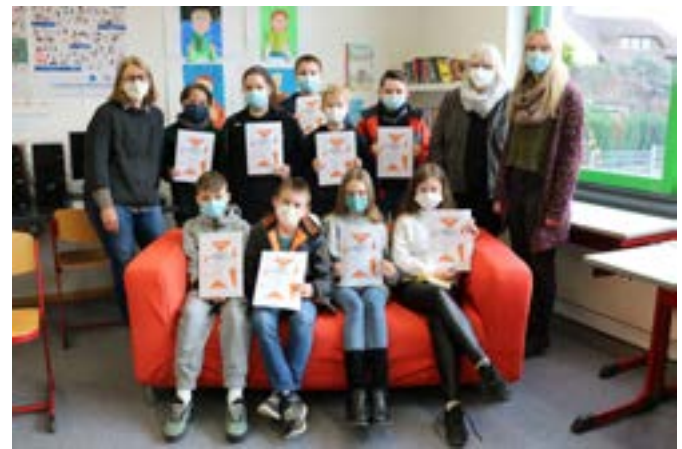
Die TeilnehmerInnen am Vorlesewettbewerb